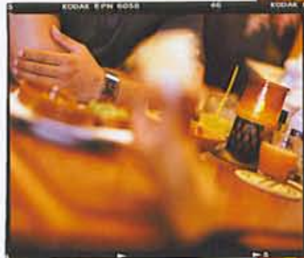
Het is ook mogelijk om 'mijn' gigolo een hele nacht te houden. Natuurlijk wordt er dan wel een speciaal tarief afgesproken.