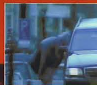
Franciska: 'Ik speel in de clip letterlijk de hoer - want ik ben geen straat- of raamprostituee - maar dit was gewoon een normale, betaalde opdracht.'